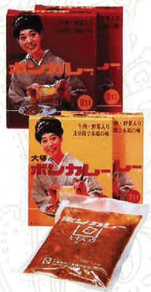
発売当初の大塚食品「ボンカレー」。コンセプトは「一人前入りで、お湯で温めるだけで食べられるカレー、誰でも失敗しないカレー」。

これにより家庭でもカレーが作られるようになり、庶民の食べ物として普及していきました。大阪といえばかつて「天下の台所」と呼ばれた地。時を同じくして、カレーを使ったアレンジ商品を次々に生み出します。今では蕎麦屋やうどん屋で当たり前のように見かける「カレー蕎麦」「カレーうどん」が作られるようになり、カレーライスよりも低価格で食べられることから、庶民の間で大人気となりました。さらに昭和初期の東京では「洋食パン」という名称でカレーパンが販売されています。カレーは「カレーライス」とどまらず、日本人の舌に合う形や味へとさまざまな変化を遂げていったのです。