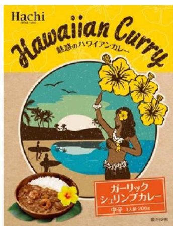
ガーリックシュリンプカレー パッケージ