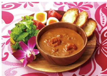
ガーリックシュリンプカレー