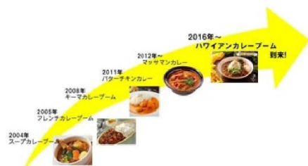
ハワイアンカレーブーム到来？！